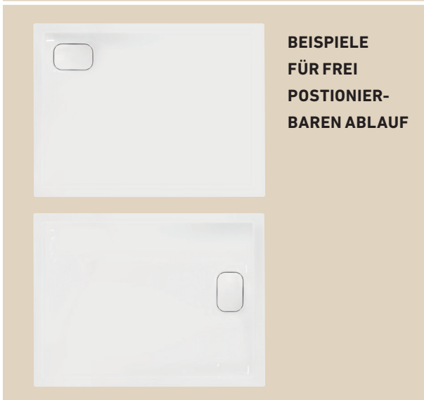
BEISPIELE FÜR FREI POSITIONIER- BAREN ABLAUF