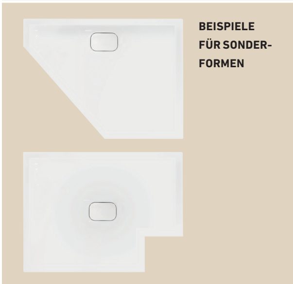
BEISPIELE FÜR SONDER- FORMEN