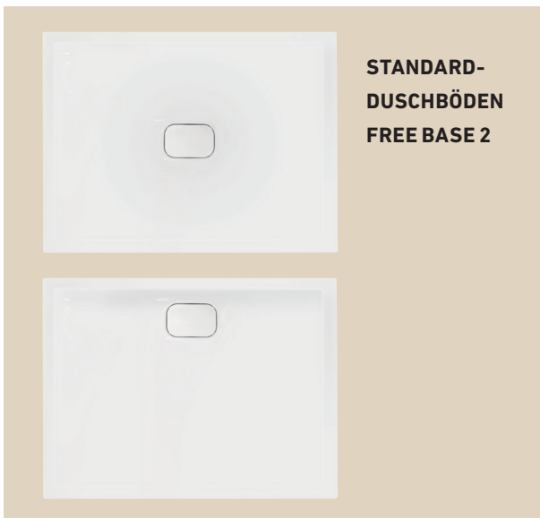
STANDARD-DUSCHBÖDEN FREE BASE 2